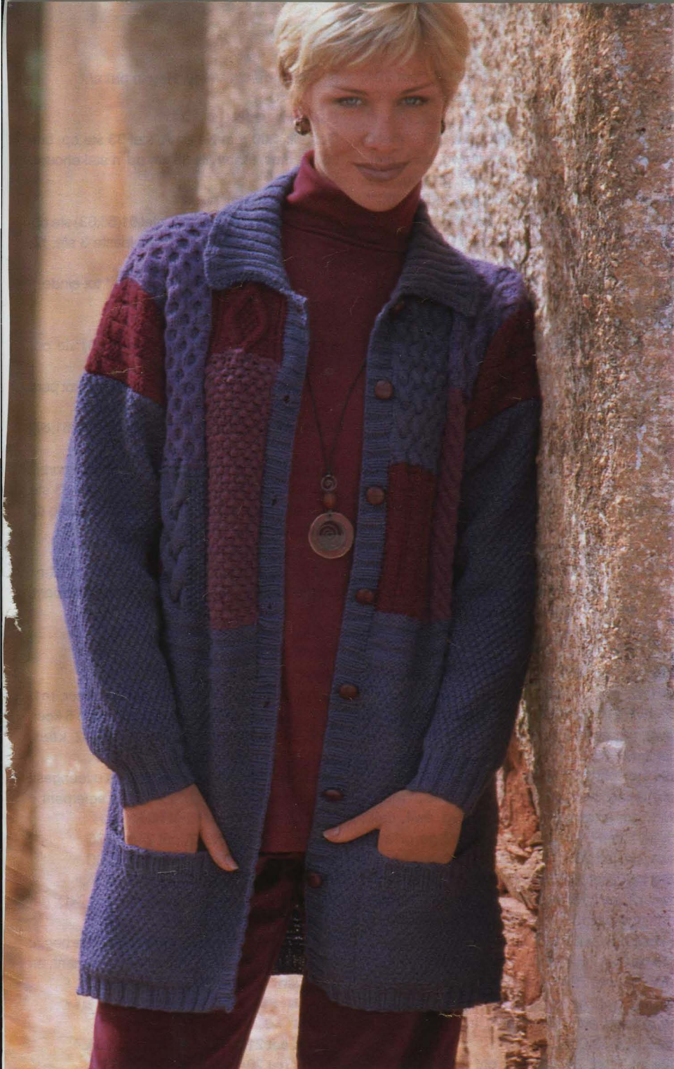
patroon ontwerp en ontwikkel deur Saprotex International; vertaal deur Sjoukje Jordaan

r2**, pgv, met B, r1, aw8, r1, pgv, *met C, r2, aw1, r1, (aw3, r1, aw1, r1) 3 keer, r1, pgv, met D, r4, aw16, r4, pgv, met C, (aw3, r5) 2(3;4) keer, aw3(3;1), r2(0;0)*. 9e ry: *met C, r1(3;1), (aw1, r3) 5(6;8) keer, met D, aw4, r2, k4a, r4, k4v, r2, aw4, ga, met C, aw1, (aw1, r1, aw4) 3 keer, aw1, r1, aw2*, ga, met B, aw1, k8a, aw1, ga, **met D, aw24, ga, met A, (r1, aw1) 2 keer, r17, (aw1, r1) 2 keer, met C, (r3, aw1) 5(6;8) keer, r1(3;1)**. 10e ry: **met C, aw1(0;0), r4(3;1), (r1, aw3, r4) 2(3;4) keer, pgv, met A, (r1, aw1) 2 keer, r1, aw15, r1, (aw1, r1) 2 keer, pgv, met D, r2, (3-uit-1,