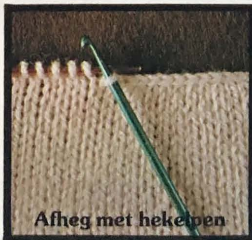
Afheg met hekepen