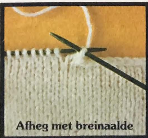
Afheg met breinaalde

Nou volg 'n paar wenke in verband met die vorming en versiering van kledingstukke