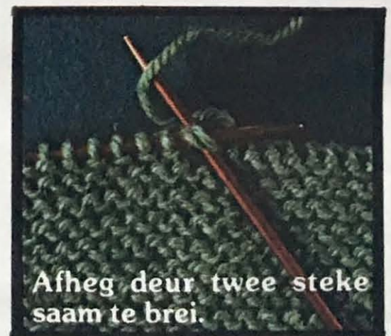
Afheg deur twee steke saam te brei.