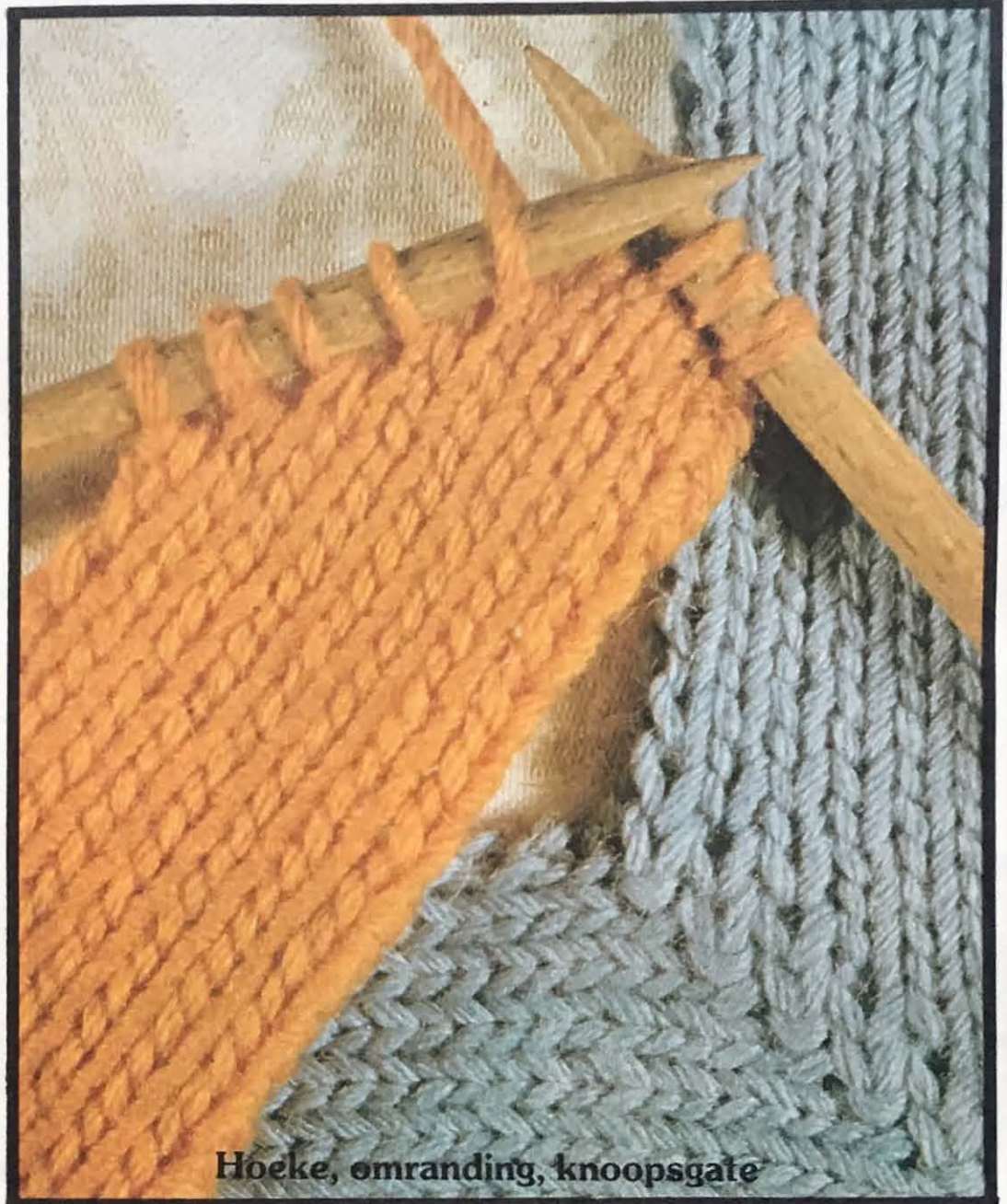
Hoeke, omranding, knoopsgate

'n Lus moet ook gedefinieer word, want daar is 'n besliste verskil tussen die voor- en agterkant van 'n lus tussen twee steke op wedersydse breinaalde. Wanneer in die voorkant van so 'n lus gebrei word, word een patroon gevorm terwyl heeltemal 'n ander